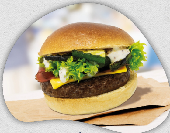
Burger oder Wraps