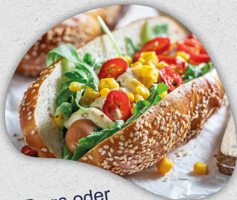
Hot Dogs oder Sandwiches

Helmut Karasek, deutscher Journalist & Autor