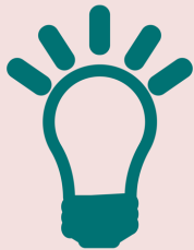
Idee & Name