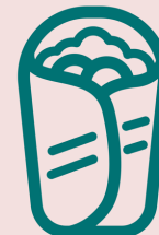
Optik & Geschmack